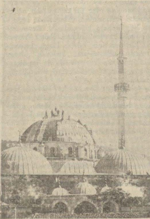
Tamirine başlanan Büyükcami

Yozgat (Hususi) — Yozgatta eski eserler muhafaza edilmektedir. Bun- ların mühimlerinden olan Büyükcami orta Anadolu'da ikincisine tesadüf edil- miyen güzel bir eserdir. Bu eser Nev- şehirden Koca Sinanın çırakları tara- fından meydana getirilen damat İbra- him paşa camiine bazı teferrüatı benze- mekte olduğundan bu eserin de gene koca Sinanın çırakları tarafından y-