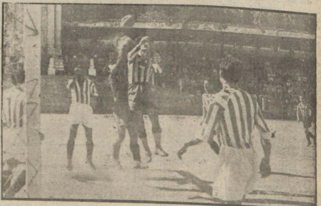
Dünkü Fener - Yefa maçından bir intiba (Yazısı 7 nei sayfamızda)